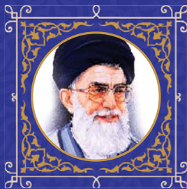
مقام معظم رهبری (مدظله العالی):

هر کسی در هر رتبه‌ای به مردم این استان دارد خدمت میکند، باید خدا را شکرگزار باشد. واقعاً این مردم، این انسانهای فهیم، لطیف و باذوق، شایسته‌ی خدمت‌کردند؛ حقاً و انصافاً خدمت به این مردم لذت بخش است. البته خود شما هم اغلب از همین مردمید. انسان وقتی خصوصیات و خلیات مردم شیراز و مردم فارس را ببیند، احساس میکند که خدمت به این مردم با این خصوصیات، با این خلیات، با این لطافت، با این نکته‌سنجیها، با این استعدادهای فراوان و سرشار، حقاً و انصافاً برای انسان یک اقبال است. یک شانس است؛ این را قدر بدانید.