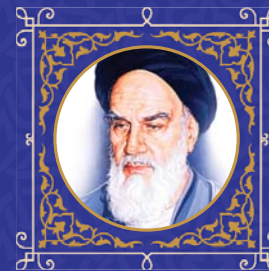
بنیانگذار کبیر انقلاب اسلامی (ره):

عمده این است که ما به اسلام خدمت کنیم، خدمت به ملت، خدمت به اسلام است... امروز هر خدمتی که انجام دهیم، خدمت به اسلام است، هر خدمتی که مردم به آن احتیاج داشته باشند، خدمت به اسلام است. آنها لایق این هستند که ما با تواضع به خدمت آنها برویم و برای آنها خدمت کنیم، همه ما خدمتگزار آنها باشیم. آنها به ما منت دارند که ما را از این قیدی که ابر قدرت‌ها به دست و پای ما بسته بودند نجات دادند. آنها بر کشور ما منت دارند که اسلام عزیز را در این کشور حاکم کردند.